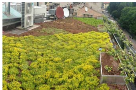
Con un sistema d'irrigazione a goccia è assicurata una crescita ottima delle piante.