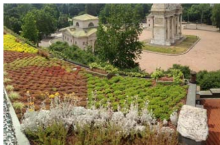
Grazie alla mano artistica del giardiniere è stata realizzata una combinazione armonica di colori e un disegno fantastico.