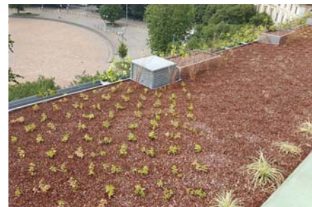
Per nascondere le fioriere sono state piantate delle graminacee intorno.