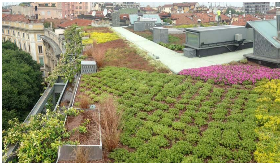
Un anno dopo la piantumazione il tappeto di varie specie di Sedum si è quasi chiuso al 100%.