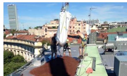
Il substrato Zincoterra è stato posato sul tetto attraverso dei BigBag, con l'aiuto di un'autogru