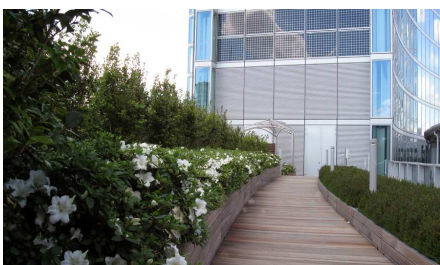
Al di sotto della pavimentazione, ma anche sotto alle aiuole si trova il sistema tetto verde ZinCo.