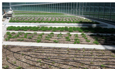
Per un'irrigazione supplementare sono stati installati dei tubi gocciolatori.